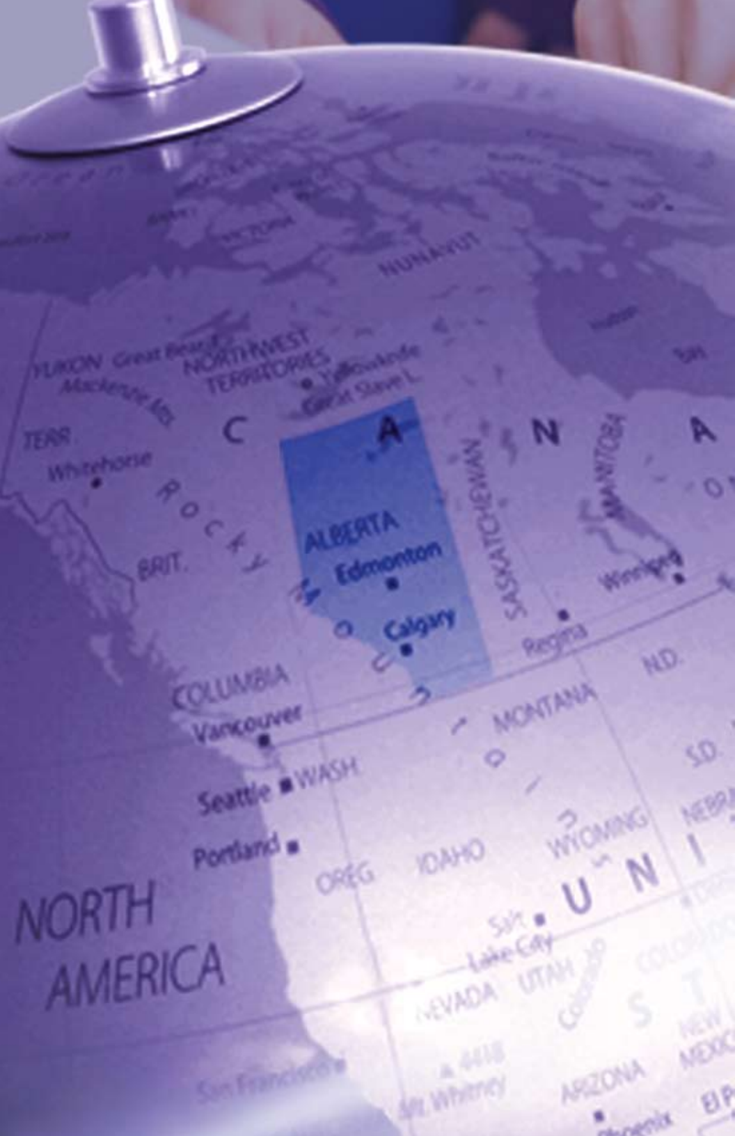
Table of Contents / Índice